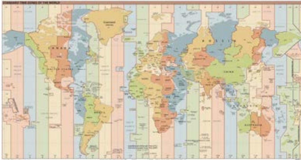
Ferskillende lannen hâlde ferskillende tiidsônes oan.