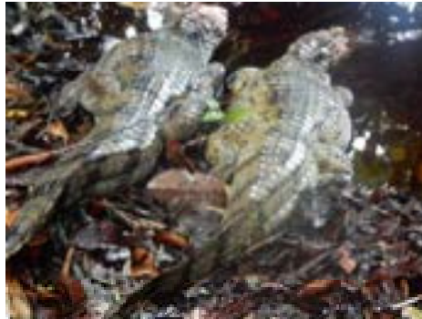
Twa lytse kaaimannen foar de saté