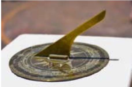
In sinnewizer jout mei it skaad de tiid oan.

In wrâldreizger is eins ek in tiidreizger. Ast oer de wrâld reizgest komst yn ferskate tiidsônes. Giest dan wol net jierren tebek yn 'e skiednis, of jierren foarút de takomst yn, mar silst dyn horloazje ûnderweis gauris fersette moatte. De hear Phileas Fogg tiidreizget ek yn it ferhaal In wrâldreis yn 80 dagen, en hellet sels in dei yn. Hoe sit dat? Kin dat eins wol echt?