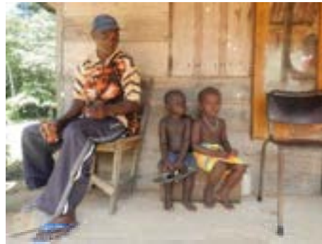
Sûnder mobylysjes of oare prikkels.