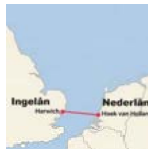
Rûte fan 'e nachtboat

It is 06.53 oere. O nee, 05.53 oere sels! We binne no ommers yn in oare tiidsône. Hoe dan ek fierstente betiid om no al op 'en paad te wêzen! Mei de nachtboat binne we nei Ingelân ta fearn en no ride we, oan 'e linkerkant fan de dyk fansels, nei ús hotel. Heit hat in stikje bôle mei Fryske tsiis yn 'e hân. Meinaam fan thús. Ik kin sa ier noch gjin hap troch de kiel krije.