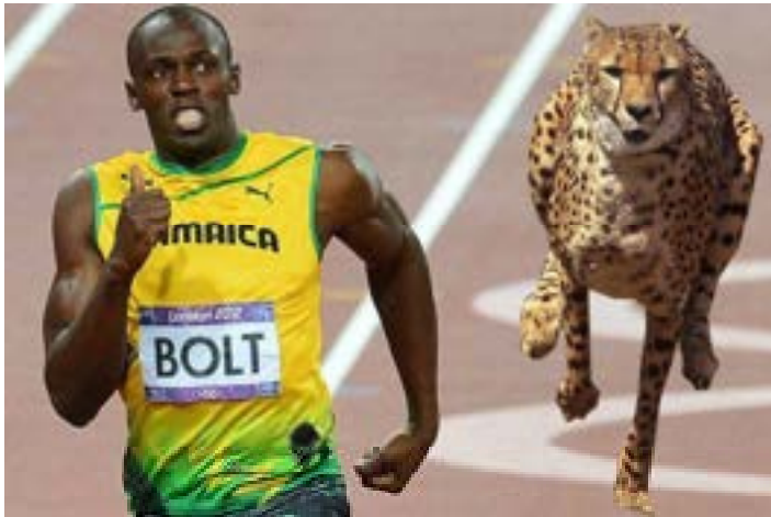
Op koarte termyn wint de fluchste mins it lang net fan in cheeta. En ek net fan in bear. (De cheeta is deryn plakt, sjoch mar nei it poatsje.)

As wy it thús hawwe oer it ferskil tusken minsken en bisten, giet it al gau oer de fysike foardielen dy't minsken hawwe. Ik wit al wat myn partner dan seit: 'Minsken kinne switte!' Krekt as is dat briljant. Ja, it is wier dat de mins de measte bisten der op lange termyn út drave kin. Ast mar lang genôch trochrinst, dan wint de mins it fan alle lân-bisten fanwege ús mooglikheid om te switten.