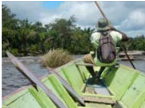
It oerwâld oan wjerskanten fan Wat.

Nei in pear dagen rêstich oan gie de reis fierder nei in Marrondoarp yn it binnenlân, dizze kear yn in korjaal oer de grutte Surinamerivier Wat wie dat geweldich om mei sa'n houten boat, hân makke út ien beamstam, te farren troch streamfersnellingen en tusken rotsen troch. Oan wjerskanten it oerwâld mei al dy bysûndere beammen, wylde planten, kleurige blommen, tropyske fûgels en bysûndere bisten. De Marrons begroeten ús hertlik en we krigen in sliepplakje yn in hutte. De Marrons libje noch hiel primityf en tichteby de natuer. As se siik binne dan geane se earst nei har eigen medisynman. Dy wit in hiele soad oer genêskrêftige krûden út it oerwâld. It wie in hiele ûnderfining om in pear dagen krekt as harren te libjen, sûnder mobylysjes of oare prikkels en te genietsjen fan de lytse dingen sa as de bern dy't yn it wetter boartsje en sa'n wille hawwe.