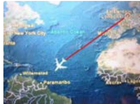
De fleanreis

Gelokkich dat ik in goed boek by my hie, want de reis mei it fleantúch nei de oare kant fan de Atlantyske Oseaan duorre hast 10 oeren. Suriname leit hielendal yn in noarden fan Súd Amerika. Wat sa apart is, is dat de offisjele taal dêr Nederlânsk is, neist it Surinaamsk. Dat komt om't Suriname, oant 1954 ta, hast 300 jier in kolony fan Nederlân west hat. Sûnt 1975 is Suriname in ûnôfhinklike Republyk.